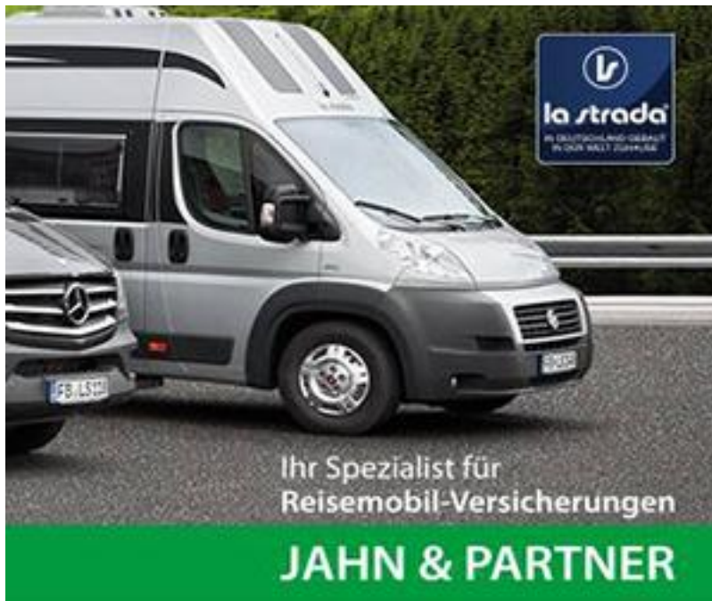
Banner D 970x250 Vollbanner Header oben breit