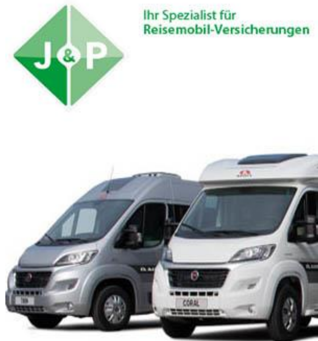
Banner C 300x600 Skyscraper breit rechts