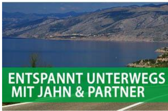
Banner A 728x90 Vollbanner Header oben schmal